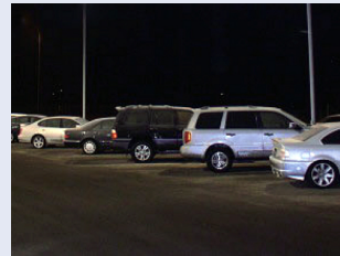
※一切、照明が無い場所では撮影できません。撮影場所に明るさに応じて、カラー度合は変化します。