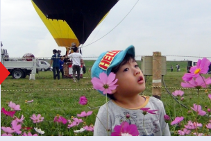
※写真はイメージです。5メガは縦横比の関係上、左右方向へ広がります。