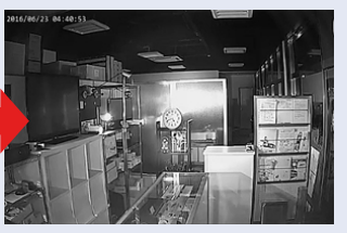
※照明が無い場所を、白黒動画で暗視撮影を行います