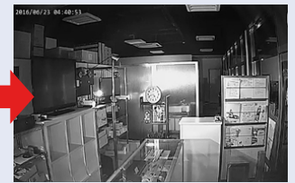
※デュアル LED：赤外線暗視時は白黒、スマート検知時はカラーで撮影