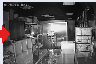
※照明が無い場所を、白黒動画で暗視撮影を行います