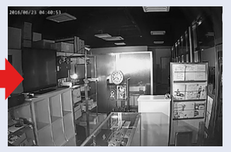
※照明が無い場所を、白黒動画で暗視撮影を行います