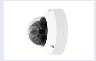
※設置時には被写体から 1m 以上、カメラを離してください