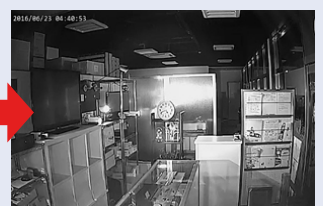
※照明が無い場所を、白黒動画で暗視撮影を行います