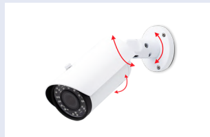
※設置時には被写体から1m以上、カメラを離してください