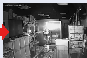
※照明が無い場所を、白黒動画で暗視撮影を行います